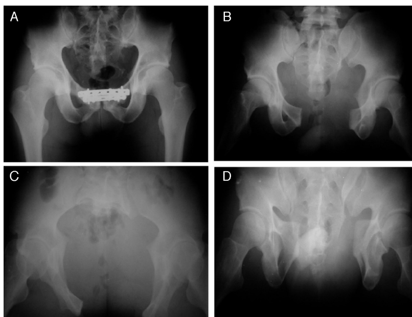
Figura 1 – Radiografias de fratura do anel pélvico. (A) Fratura de pelve tipo B de Tile, radiografia de frente. Imagem do arquivo do Grupo de Quadril do DOT-ISCMSP; (B) Fratura de pelve tipo B de Tile, radiografia inlet. Imagem do arquivo do Grupo de Quadril do DOT-ISCMSP; (C) Fratura de pelve tipo B de Tile, radiografia outlet. Imagem do arquivo do Grupo de Quadril do DOT-ISCMSP; (D) Fratura de pelve tipo B de Tile, radiografia pós-operatória. Imagem do arquivo do Grupo de Quadril do DOT-ISCMSP.

Nesse contexto, as fraturas do anel pélvico, que compõem de 2% a 8% de todas as lesões do esqueleto, incidência que aumenta para 25% nos politraumatizados, representam fator prognóstico negativo no que diz respeito à morbidade e à mortalidade do paciente politraumatizado e nos estimularam a estabelecer o perfil epidemiológico dessas fraturas a partir de revisão bibliográfica. 22