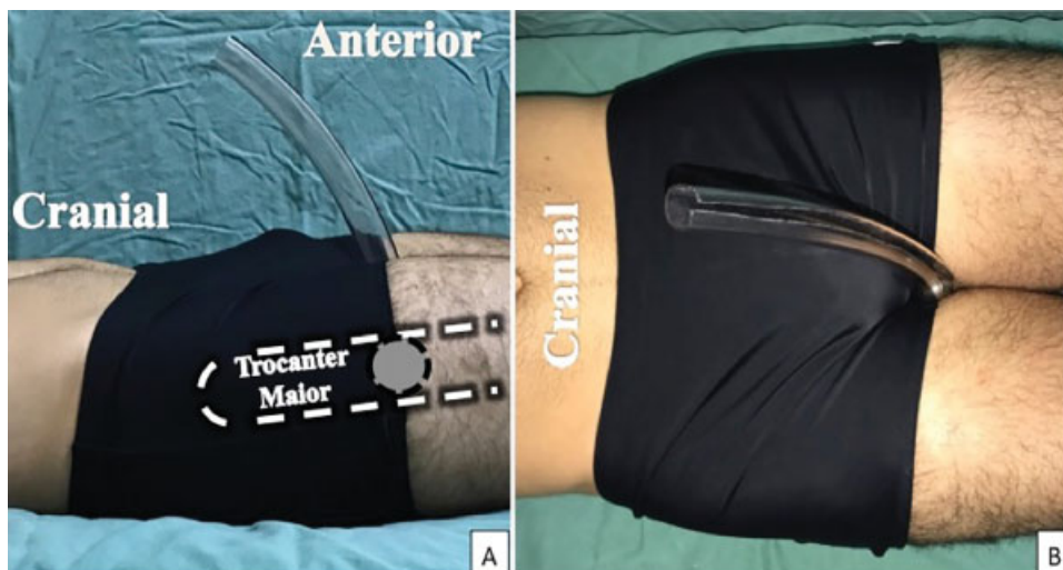
Fig. 2 Posicionamento da esfera entre as coxas, no plano do trocãter maior, vista em perfil (A) e vista anterior (B).

Os intervalos de confiança (ICs) nesse trabalho foram construídos com 95% de confiança estatística. A amostra com N